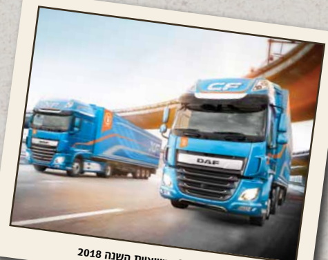
דאף XF ו-CF: משאיות השנה 2018