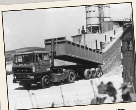
1973: חידוש טכנולוגי נוסף - מצנן Intercolling