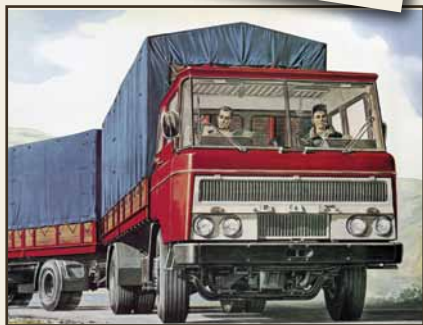
1960: תחילת התובלה הבינלאומית