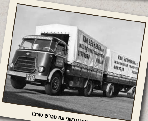
1959: מנוע חדשני עם מגדש טורבו