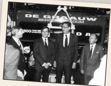
1984: ייצור המשאית ה-250,000