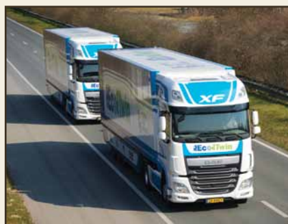
משאית ה-ECO TWIN: בדרך לנהיגה אוטונומית