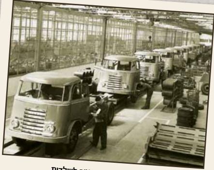
1950: פתיחת קו הייצור לשלדות

1980 דאף משיקה את טכנולוגיית ATI - Advanced Turbo Intercooling, לשיפור בהספק וביעילות על ידי טכנולוגיית הזרקה ותצורה אופטימלית של תא הבעירה.