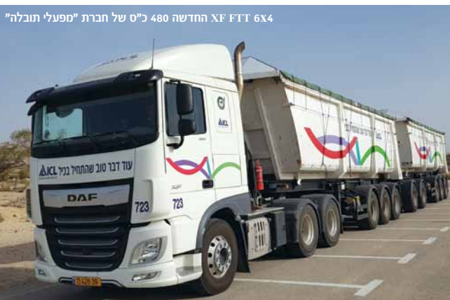
XF FTT 6x4 החדשה 480 כ"ס של חברת "מפעלי תובלה"

משנת 2016 מטמיעה החברה טכנולוגיות מתקדמות נוספות, כמו רכבים עם תיבת הילוכים רובוטית המתאימה את פעולת המנוע לתנאי הדרך. בכך, היא הצליחה להגביר את יעילותו המרבית של המנוע ולקדם עוד יותר חיסכון בצריכת הדלק, נוחות תפעולית ונהיגה בטוחה. "הדאפים החדשים עומדים בדרישות הגבוהות שלנו בכל הקשור להתייעלות, תחזוקה ובטיחות", מציין ניסים, "אנשי ההנדסה