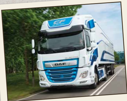
משאית CF חשמלית: יותר אנרגיה ירוקה