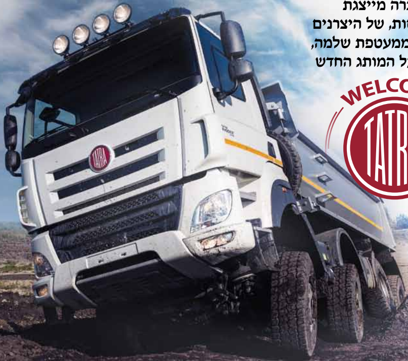
בתמונה: TATRA PHOENIX EURO6 8x8