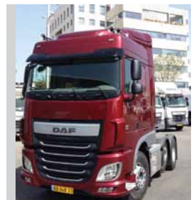
גורר/תומך XF 46 טון "פושר" של אברהם נורי (6X2)

גיליון 4 • ספטמבר 2016 עורכות: הילה בשארי, מיה אוריין • עיצוב ועריכה: שריג רעיונות לתגובות: hilab@tashtit.co.il www.daf.co.il • sales@tashtit.co.il • 1-800-717-111