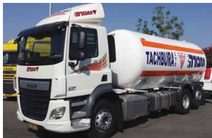
משאית CF 26 טון עם היגוי אחורי של תחבורה אגודה שיתופית מרכזית בחקלאות בע"מ