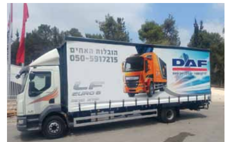
משאית LF 12 טון, עם גלגלים גדולים, של הובלות האחים