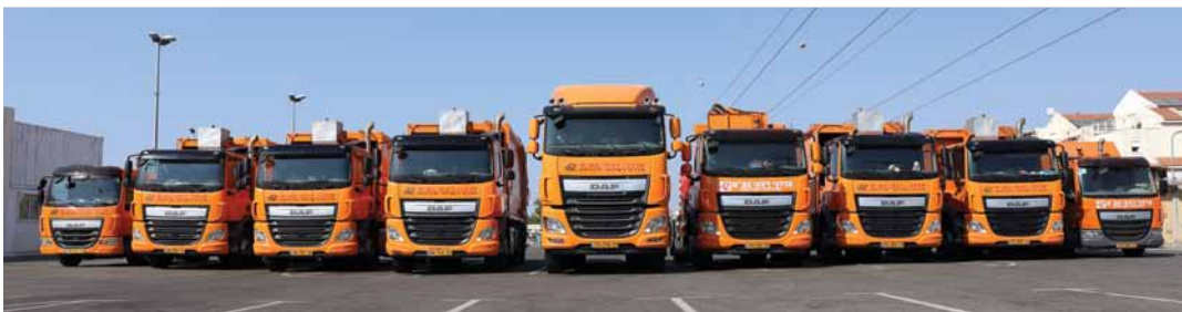
חברת מרדכי זיבאי בע"מ הצטיינה בארבעת החודשים האחרונים ב-14 משאיות דאף חדשות מסוג CF, XF ו-LF ובמתקן רמסע מתוצרת VDL. החברה מתמחה בפינוי אשפה באמצעות מרכבי דחס, מנופים, מכונה לטיפת פחי אשפה ומתקני שינוע (רמסע).