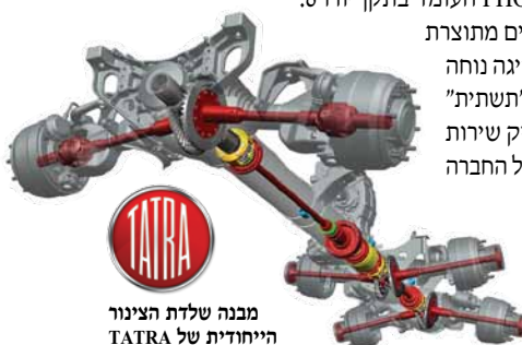
מבנה שלדת הצינור הייחודית של TATRA

מדובר במשאית OFF ROAD מהטובות בעולם מסוגה, המיוצרת על בסיס קונספט ייחודי: שלדת צינור, העוטפת את כל רכיבי ההנעה באופן קשיח ועמידה בפני כיפופים או פגיעות, וסרנים בעלי מתלה נפרד. מערכת העברת הכוח עמידה באופן מיוחד ומבנה הצינור מאפשר את הפרדת הסרנים ל"חצאי סרנים", כאשר לכל צד של הסרן מתלה נפרד. קונספט זה הופך את משאיות TATRA לרכבי המשא בעלי העבירות הגבוהה ביותר בעולם, כולל בשטחים חוליים, סלעיים, בוציים ואף