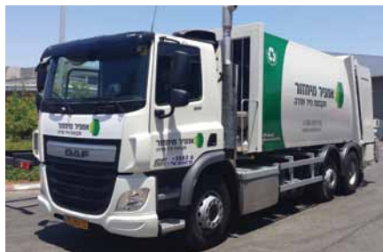
משאית CF 26 טון "פושר" לדחס של אמני מיחזור מקבוצת נייר חדרה