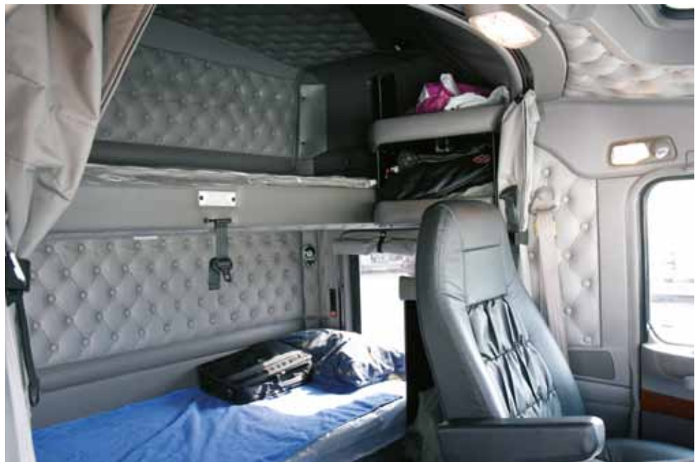
חדר השינה מציע מיטות קומותיים ומרווח ראש נדיב

☺ רוק מתזמן את החלפת ההילוכים בדיוק רב. דושת הקלאצ' נשארת מחוסרת עבודה. הוא משתמש בקלאצ'. רק בתחילת נסיעה ובעצירה. את הנסיעה הוא מקפיד להתחיל בהילוך ראשון גם אם מנוע ה-T660 יסבול יציאה מהמקום בהילוך גבוה יותר. פארוק רוצה קלאצ' מאריך חיים. בקנורות' הקודם שלו שרד הקלאצ' 700,000 ק"מ לפני שהוחלף. צומת שילת, מטפסים לעבר קריית ספר. פארוק מצביע על משאיות החולפות בנתיבים ממול. לאורך המיכל הנגרר מאחוריהן מסומנים שני פסים כתום