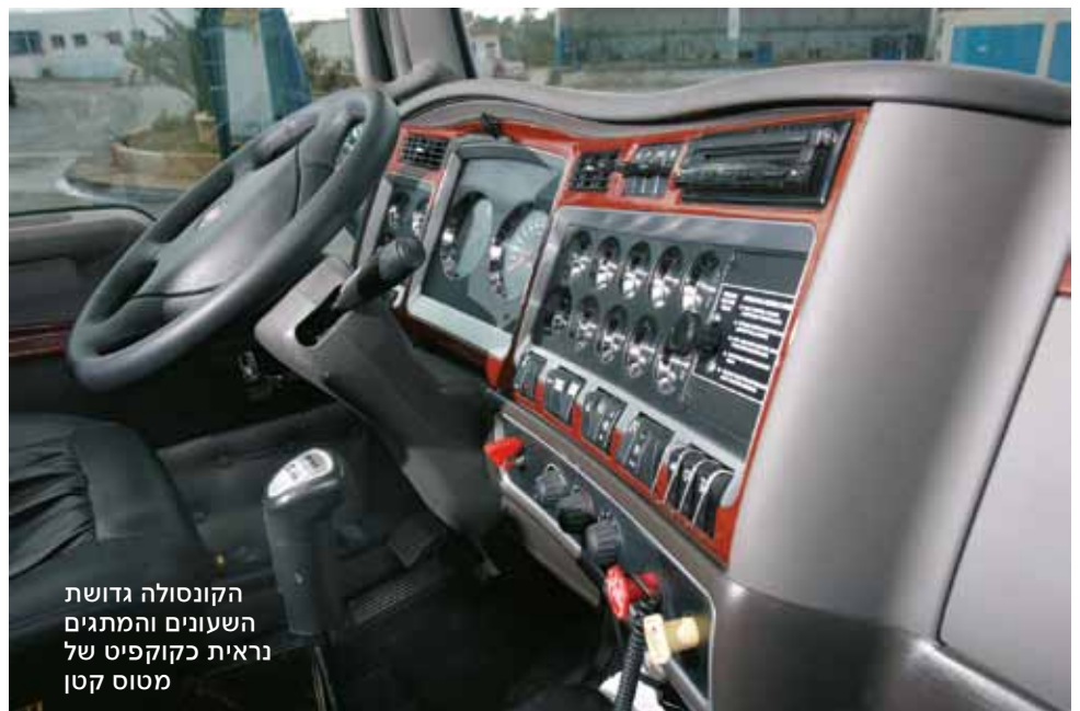
הקונסולה גדושת השעונים והמתגים נראית כקוקפיט של מטוס קטן